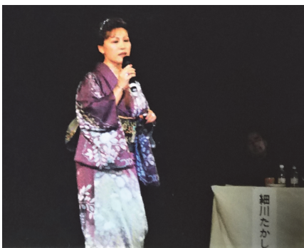
港工後援会会員がコマ劇場の大舞台で！！

この側面(側面)で判断すると、「コロナ」の為に一般医療(一般医療)が疎(おろそ)かになつては成(な)るまい。 私は現在室内(室内)を歩くのが「やっと」で、かろうじてシルバーカー(自立歩行を補助する車輪のついた歩行器)に頼(た)まがって半径500m程度(程度)を歩くことが出来ます。普段(普段)、怪我(けが)や病氣(病気)と無縁(むげん)な私(わたし)には健康(けんこう)が如何(いか)に幸(さい)せて有難(ありがた)いことかと痛感(つら)しております。 おいおい私(わたし)の人となり(人となり)(生まれつきの人柄(じんがら))は皆さん(みなさん)に知(し)っていただき(いただき)たいと思(おも)っています。 さて、毎月開催(開催)していた理事会(理事会)の会場(会場)(大井町駅前・きゅりあん貸会議室(かひぎやうかいぎしつ))が来(き)年(ねん)2月(げつ)より改裝(かいさう)の為(ため)使用(しやう)出来(こ)なくなり(な)ります。その後の会場(会場)のメド(めど)はた(た)って(た)りませ(ませ)ん。しかしながら(しかしながら)なんと(なんと)か「同窓会(どうそうかい)ニュース」だけ(だけ)は皆さんの御手許(ごてしよ)に届(と)けるため(ため)、あらゆる努力(どりょく)を(を)する所(ところ)存(ぞん)じます。 何(なに)と(と)ぞ今(いま)後(ご)でも宜(よろ)しく、「指導(しゆどう)ご支援(しえん)のほど、お願い(ごんがい)申し上げ(しんじやう)ます。