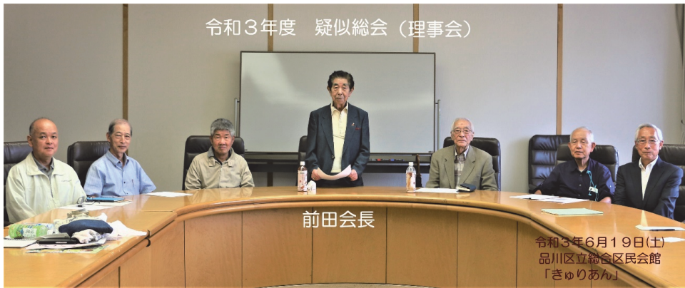
令和3年度 疑似総会 (理事会)