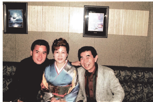
演歌歌手・細川たかしさんと！ (新宿のクラブ、VIPルームにて)