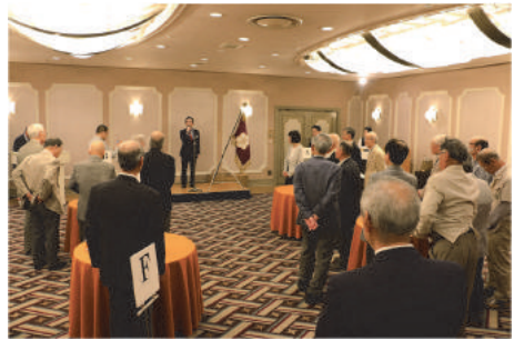
懇親会（会長挨拶）会場風景